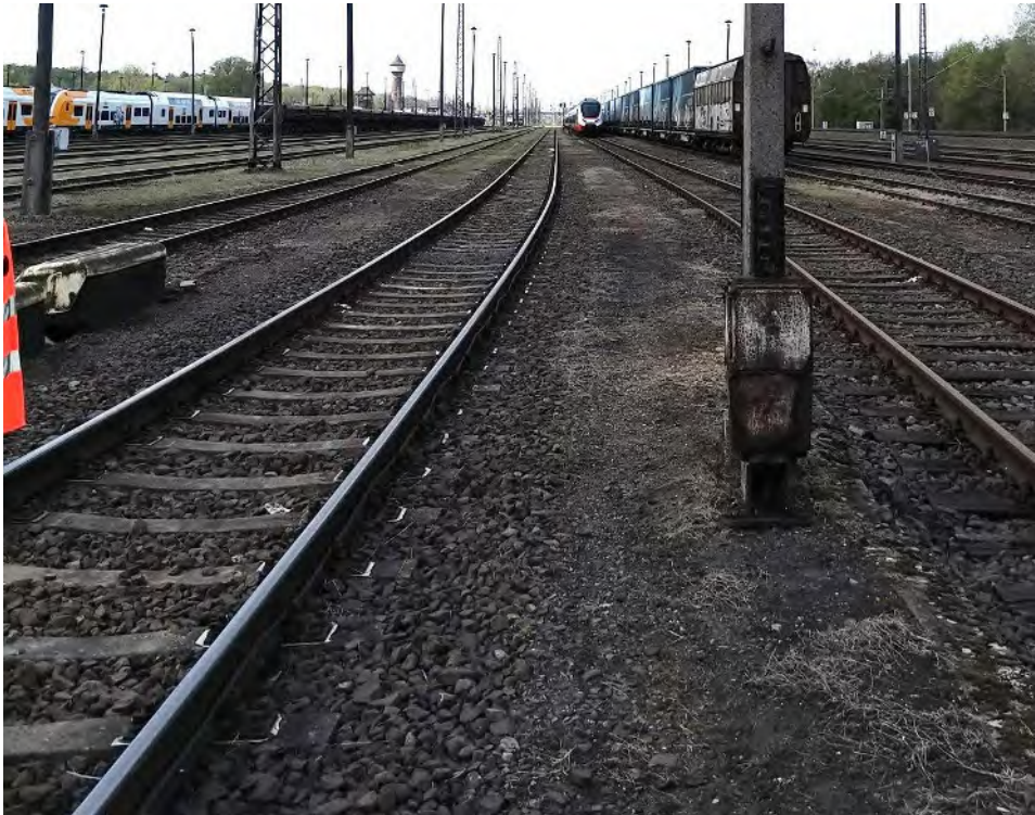
Abb. 21: Umbauende am Radiusende in Gleise 62 – Blickrichtung Westen