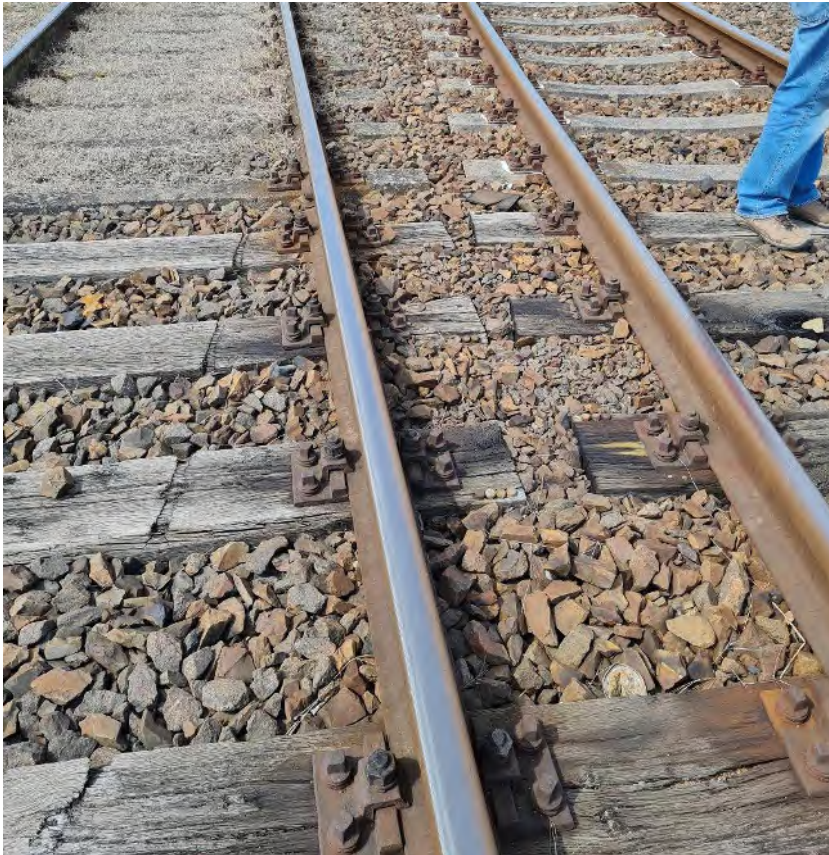
Abb. 23: Umbauende Gleise 64 = Lückenschluss Weiche 115 – Blickrichtung Westen