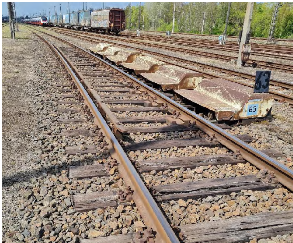
Abb. 22: Umbauende am Radiusende in Gleise 63 – Blickrichtung Westen