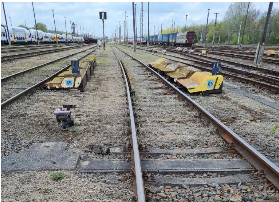
Abb. 24: Umbauende am Radiusende in Gleise 65 – Blickrichtung Westen