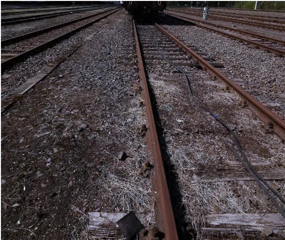
Abb. 19: Umbauende Oberbauwechsel in Gleise 60 – Blickrichtung Westen