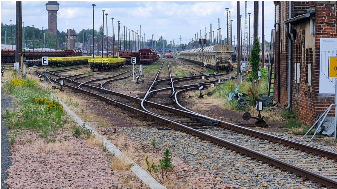
Abb. 2: Weichenharfe am RS III – Blickrichtung Westen